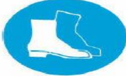
Υποχρεωτική προστασία των ποδιών