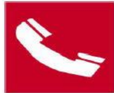
Τηλέφωνο για την καταπολέμηση πυρκαγιών