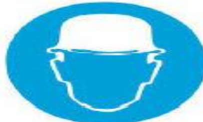
Υποχρεωτική προστασία του κεφαλιού