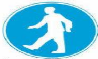
Υποχρεωτική διάβαση για πεζούς