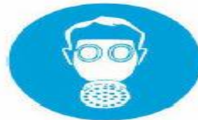
Υποχρεωτική προστασία των αναπνευστικών οδών