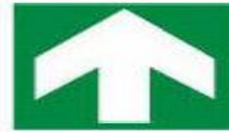
Κατεύθυνση που πρέπει να ακολουθηθεί (ενδεικτικά σήματα επιπλέον των παρακάτω πινακίδων)