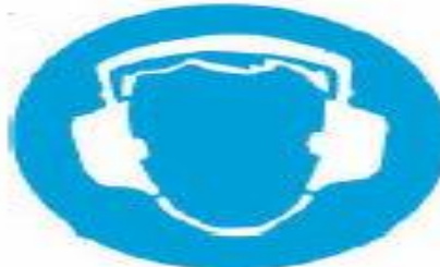
Υποχρεωτική προστασία των αυτιών