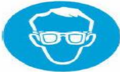
Υποχρεωτική προστασία των ματιών