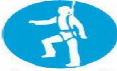
Υποχρεωτική ατομική προστασία έναντι πτώσεων