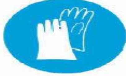
Υποχρεωτική προστασία των χεριών