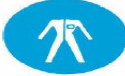
Υποχρεωτική προστασία του σώματος