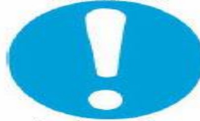
Γενική υποχρέωση (συνοδευόμενη ενδεχομένως από πρόσθετη πινακίδα)