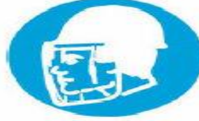
Υποχρεωτική προστασία του προσώπου